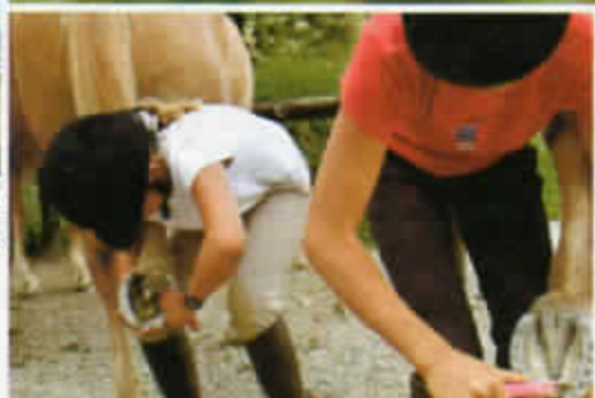
Regelmäßig Hufe auskratzen ist ein Muß. Anderenfalls können sich Entzündungen bilden