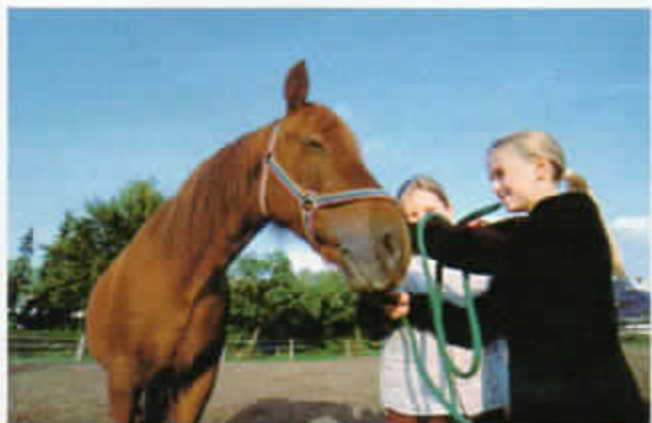
Der Traum vom Pferd – weiches Mädchen hat ihn nicht? Reiten ist in der Altersklasse von sieben bis 14 Jahren drittbeliebteste Sportart